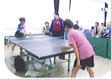
サウンドテーブルテニス大会 〔盲人卓球愛好会〕