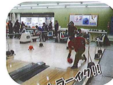
〔ボウリングクラブ〕 試合に向けて練習中!