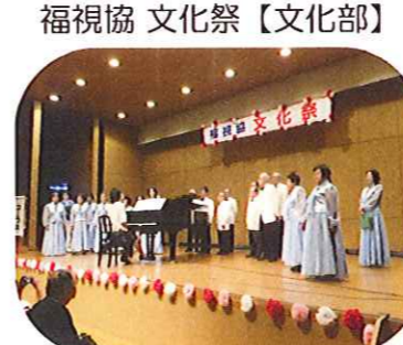
〔グリーンハーモニー〕