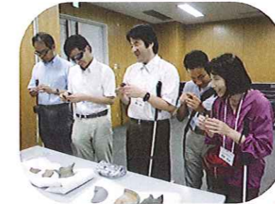
九州盲青年研修大会【青年部】 〔触って楽しむ九州国立博物館〕