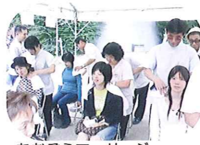
あおぞらマッサージ 【職業対策部 情報発信と啓発事業】