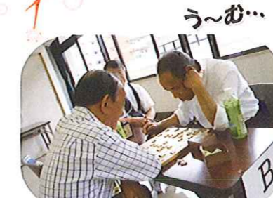
九州盲社会人将棋大会