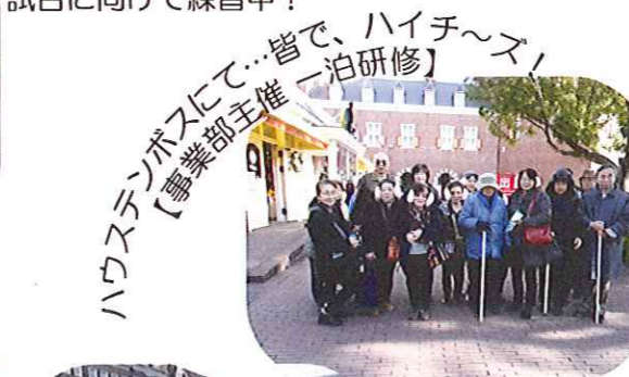
ハウステンボスにて…皆で、ハイチ〜ズ! 〔事業部主催 泊研修〕