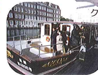
クルーザーで運河からの 景観を楽しみました