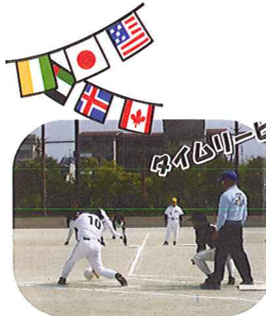
九州視覚障害者 グラウンドソフトボール大会